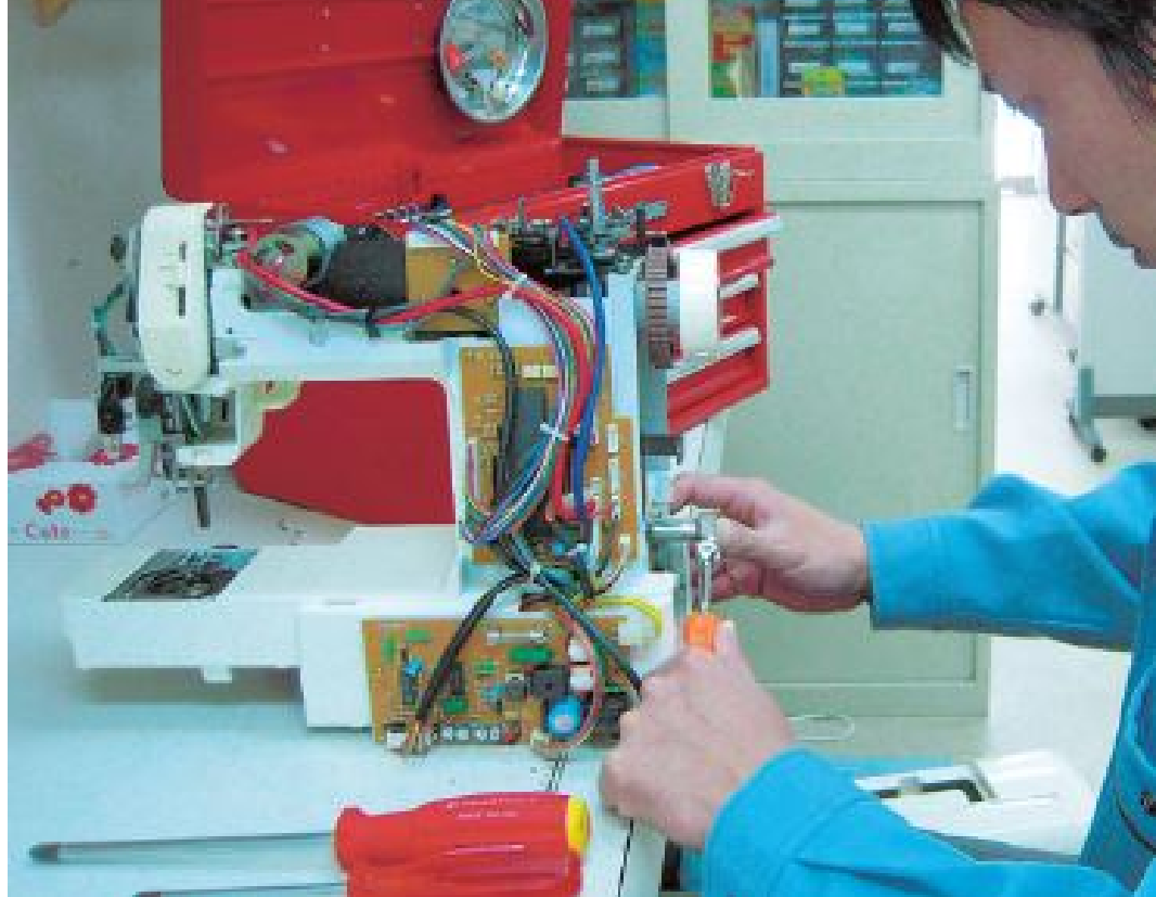
縫製環境に合わせ、調整いたします。

全メ・カ・販売、 修理のできるミシン専門店 お客様の相談にしっかりと向き合い、 ご要望にお応えします。