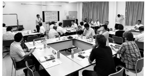
専門家から指導を受ける組合員

最終的には、各組合員が使用するデバイスにアプリをダウンロードし、組合員間のネットワーク機能(掲示板機能・連絡手段)として運用を開始した。 盛田理事長は「NASの活用により、コストをかけずできることから効率化に取組めた。引き続き、組合運営の効率化に取組んでいきたい」と抱負を語った。 (企画振興部 山崎)