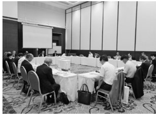
支部会様子(西部会場)